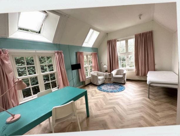
Kamer in het huis