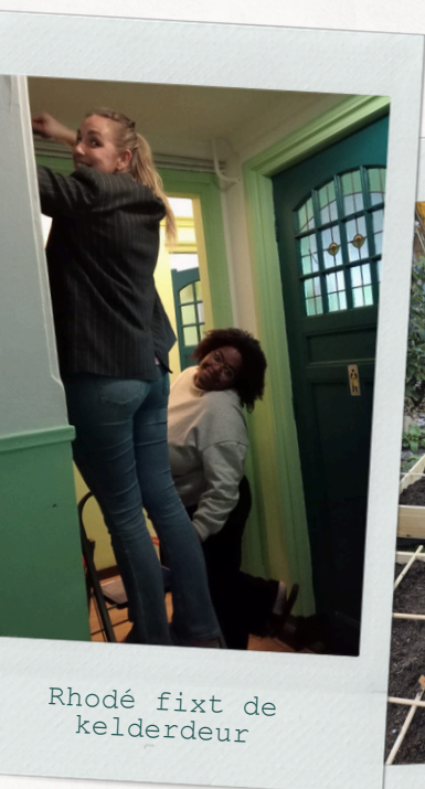
Rhodé fixt de kelderdeur

Bij een beschikbare plek, wordt in een zorgvuldige procedure door het bestuur en de vrijwilligerscoördinator een goede nieuwe match gezocht en geselecteerd.