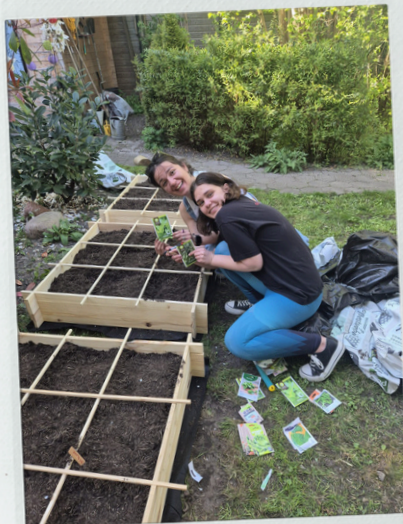
De moestuin inzaaien