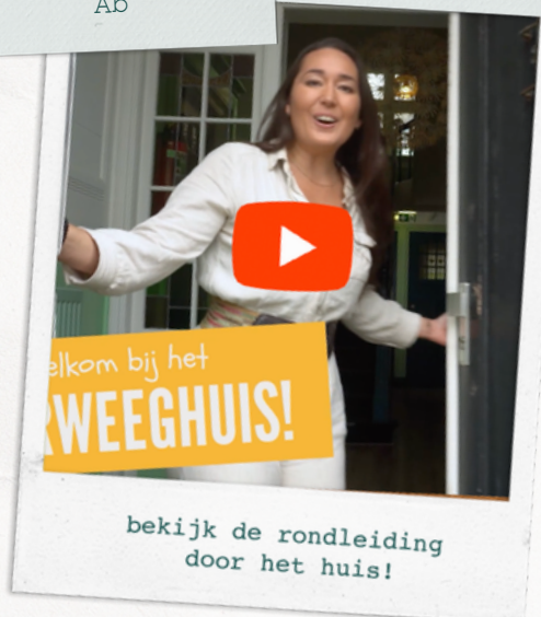
bekijk de rondleiding door het huis!