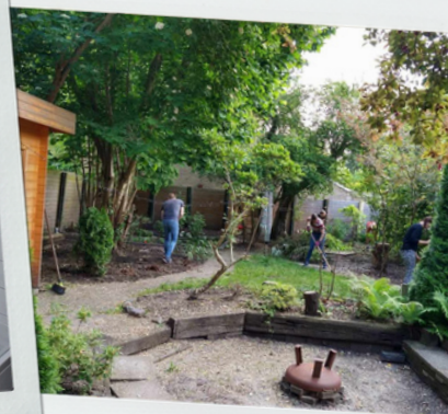
de tuin opfrissen