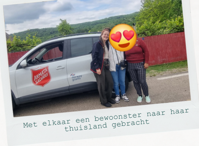
Met elkaar een bewoonster naar haar thuisland gebracht

Onder de vrouwen speelt in meer of mindere mate verslavingsproblematiek. Soms is er sprake van psychiatrische ziektebeelden. Zo nu en dan leidde dat tot turbulente situaties in huis, in een enkel geval hebben we een bewoonster gevraagd het huis te verlaten en gezocht naar een opname bij een netwerkpartner.