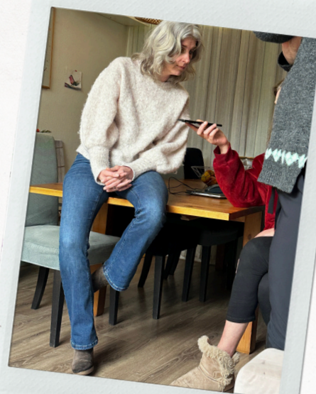
praten via een vertaalapp

In 2025 hebben we veel energie moeten steken in het opvangen en uiteindelijk goed laten doorstromen van een slachtoffer van mensenhandel met forse psychiatrische problematiek. Deze vrouw kwam in het Overweeghuis en bleek vanwege haar problematiek al snel iemand bij wie de situatie te zwaar en te complex was voor onze vrijwilligersorganisatie. Het heeft veel moeite gekost om haar via een crisisopname bij Lentis uiteindelijk te begeleiden naar haar thuisland, waar passende hulp voor haar beschikbaar is. Gelukkig kunnen wij in dit soort situaties bijzondere kosten (bijvoorbeeld begeleid reizen) betalen uit donaties en het Noodfonds.